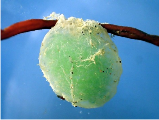
Zakje met eitjes van de Gestippelde dieseltreinworm, een worm die zeepieren eet