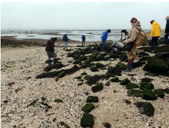
Zo begonnen we