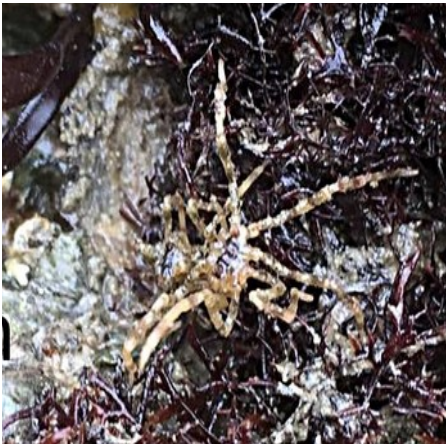
Een Hooiwagenkrabspin. Voor de duidelijkheid hier een tekening ervan