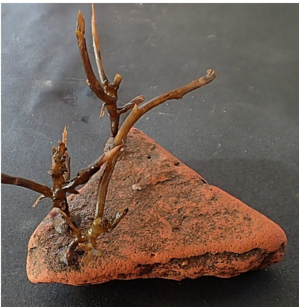
Een jong Japans bessenwiertje op een stukje dakpan

Al met al is er niets door mij verzameld, op een stukje rode dakpan na met daarop een jong Japans bessenwiertje. Goed te zien is de aanhechting op de steen, een soort zuignapje.