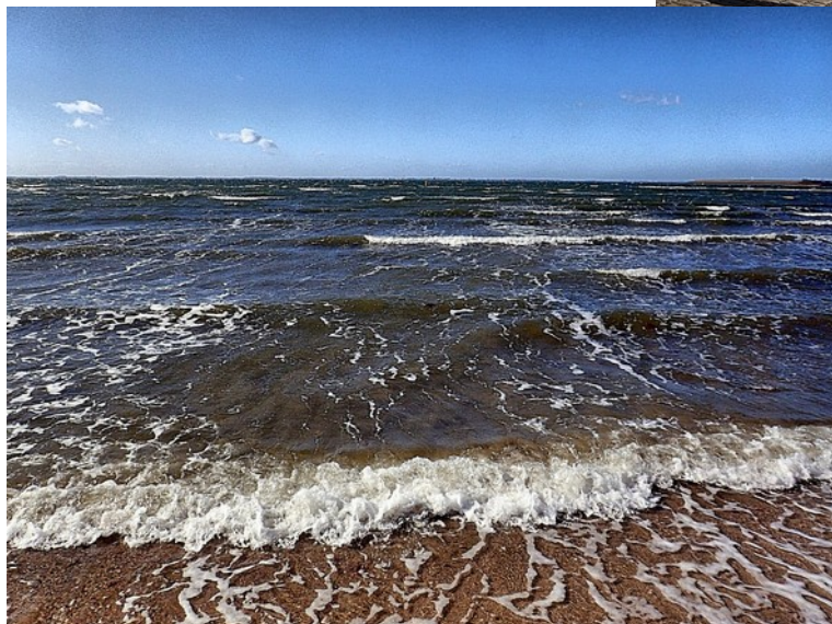
Schitterend weer met mooie golven.