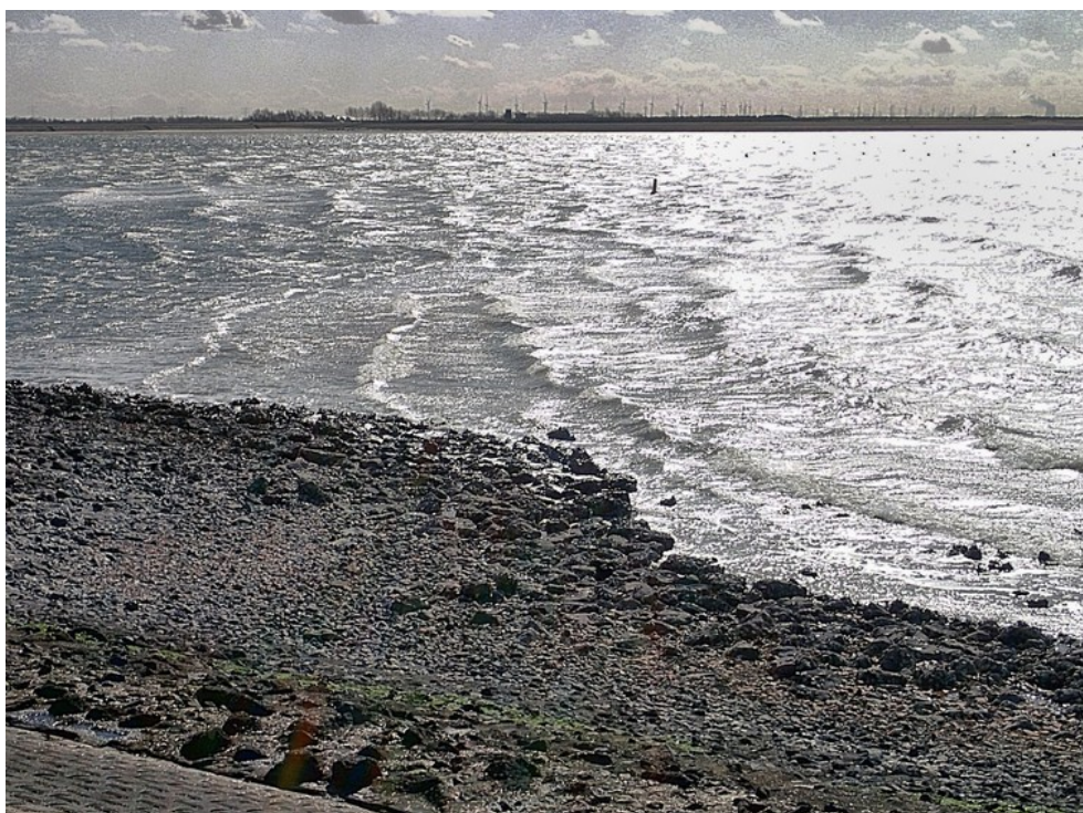
Zicht op de oude oesterput onder water, omstreeks 12:00 uur. Er was voorspeld dat het water één meter lager zou staan...

(Legende: Koning Knoet de Grote had genoeg van het gevele van zijn onderdanen. Met laag water ging hij met zijn hofhouding op het strand langs de zee staan en beval de zee om de opkomende vloed te stoppen en om aan te tonen dat de koning geen almachtige was...)