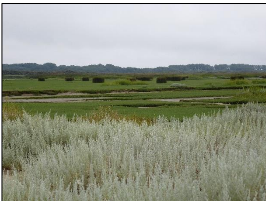
Van deze ongereptheid word je toch stil.