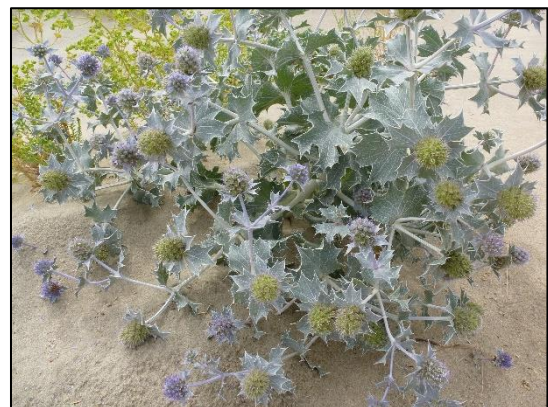
De prachtige Blauwe zeedistel.