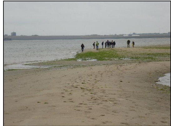
Dynamische landschap; altijd in beweging.