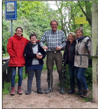
Pluisgroep Kwade Hoek 2018-2019

Begin juli van dit jaar is de natuurgidsenopleiding van IVN Voorne Putten Rozenburg en IVN Goeree-Overflakkee afgerond. Vijf studenten, die de Kwade Hoek als pluisgebied hadden, hebben toen hun welverdiende diploma gekregen. De pluisgroep Kwade Hoek had de leden van beide afdelingen uitgenodigd om een bezoek te brengen aan de strandhaak van de Kwade Hoek. Een stevige wandeling van ruim vier uur. Stipt om 09.00 uur stond een flinke groep op het parkeerterrein klaar om aan de tocht te beginnen, maar niet zonder eerst koffie met cake te hebben genuttigd. Dat ging er in als ..... koek.