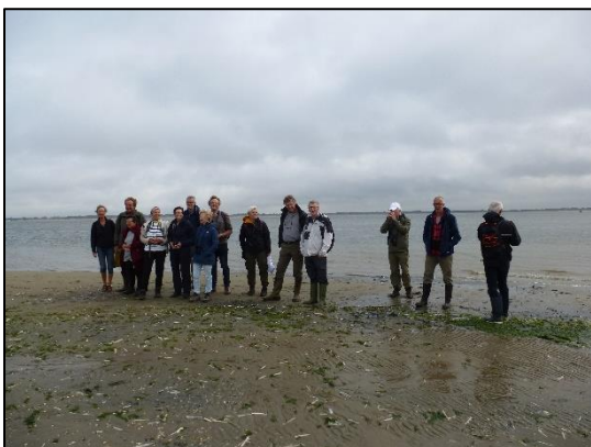
Tijd voor een groepsfoto 😊