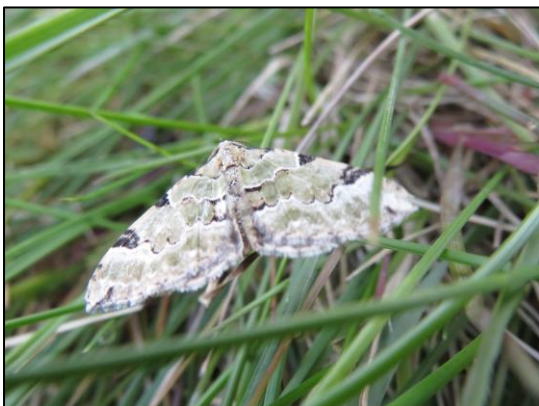
Kleine groenband spanner

Een aantal deelnemers had ook de verrekijker meegenomen. Onderweg werden nog Buizerd, Karekiet, Tuinfluiter (zingt al een "snelle Merel"), Zwartkop, Meerkoet en Wilde eend gespot en/of gehoord.