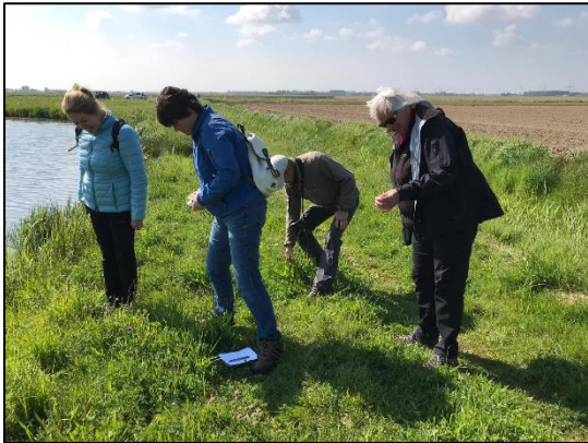
Wie het weet mag het zeggen.