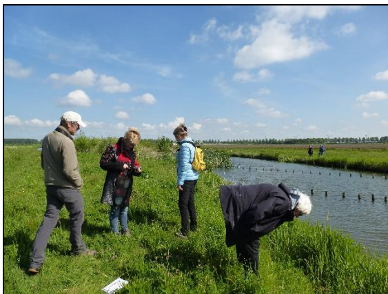
Wat hebben we hier?