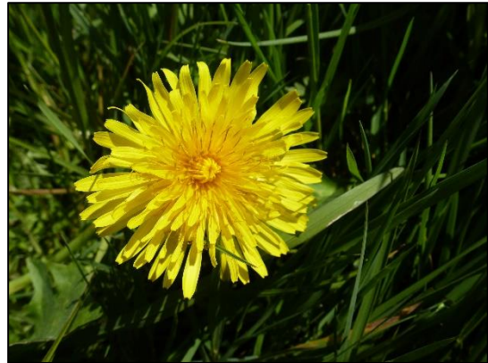
De Paardenbloem, zo gewoon en toch bijzonder.

Een aantal deelnemers had ook de verrekijker meegenomen. Onderweg werden nog Buizerd, Karekiet, Tuinfluiter (zingt al een "snelle Merel"), Zwartkop, Meerkoet en Wilde eend gespot en/of gehoord.