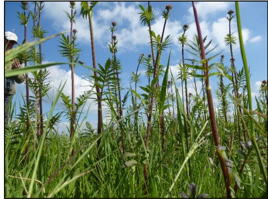
Valeriaan nog net niet in bloei.